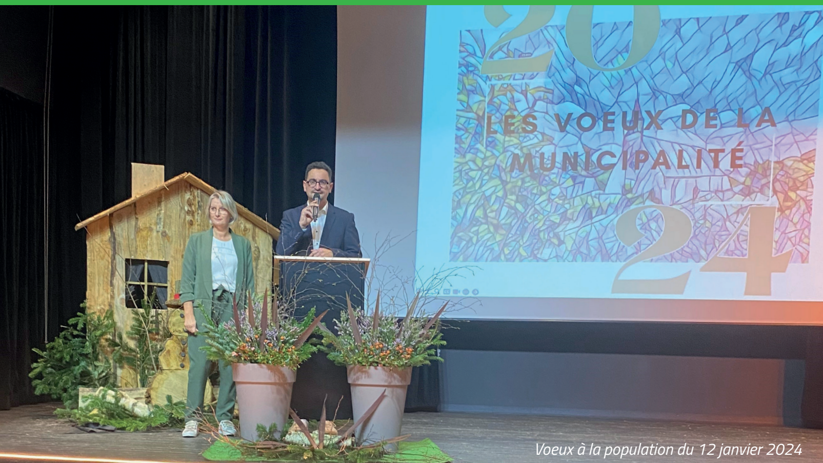
Voeux à la population du 12 janvier 2024